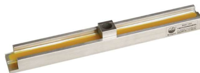
干燥时间用玻璃条涂膜导轨