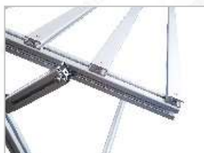
卡槽式设计，直接装卸样板