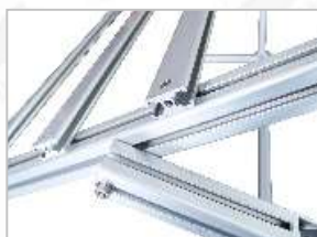
高级耐腐蚀铝型材制作