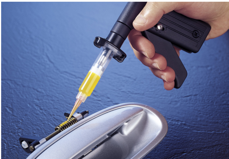
DispensGun 可简化中高粘度流体的点胶应用。