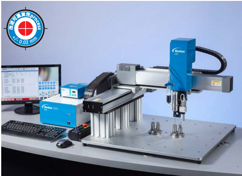
GV 系列可提供市场领先的定位精确性及胶点落点的重复性。