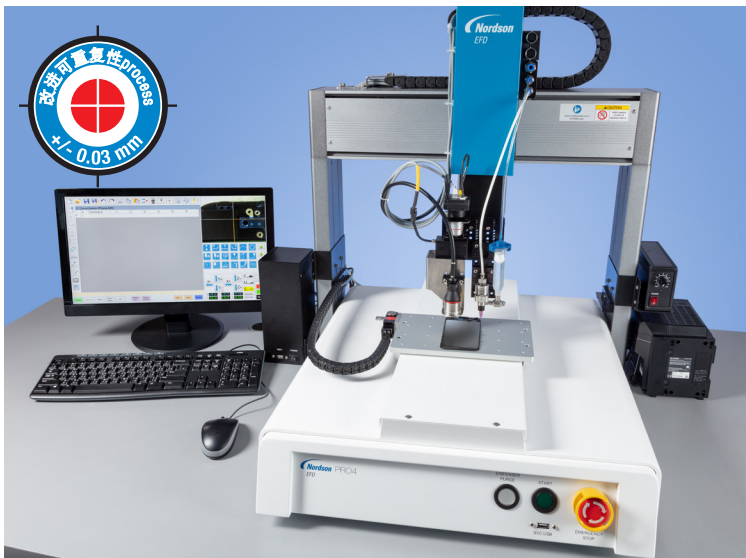
集成式视觉与激光功能使PROPlus/PRO系列产品成为一套完备的自动化解决方案