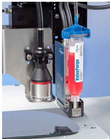
使用OptiSure共焦镭射轻松验证胶点高度测量。

诺信EFD具有视觉引导功能的PROPlus/PRO系列自动化系统专门针对EFD针筒与胶阀系统而设计和配置，能够实现精确的流体点胶。