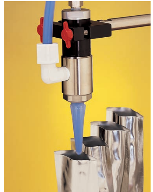
725HF-SS 将乳液灌装至小袋包装内。