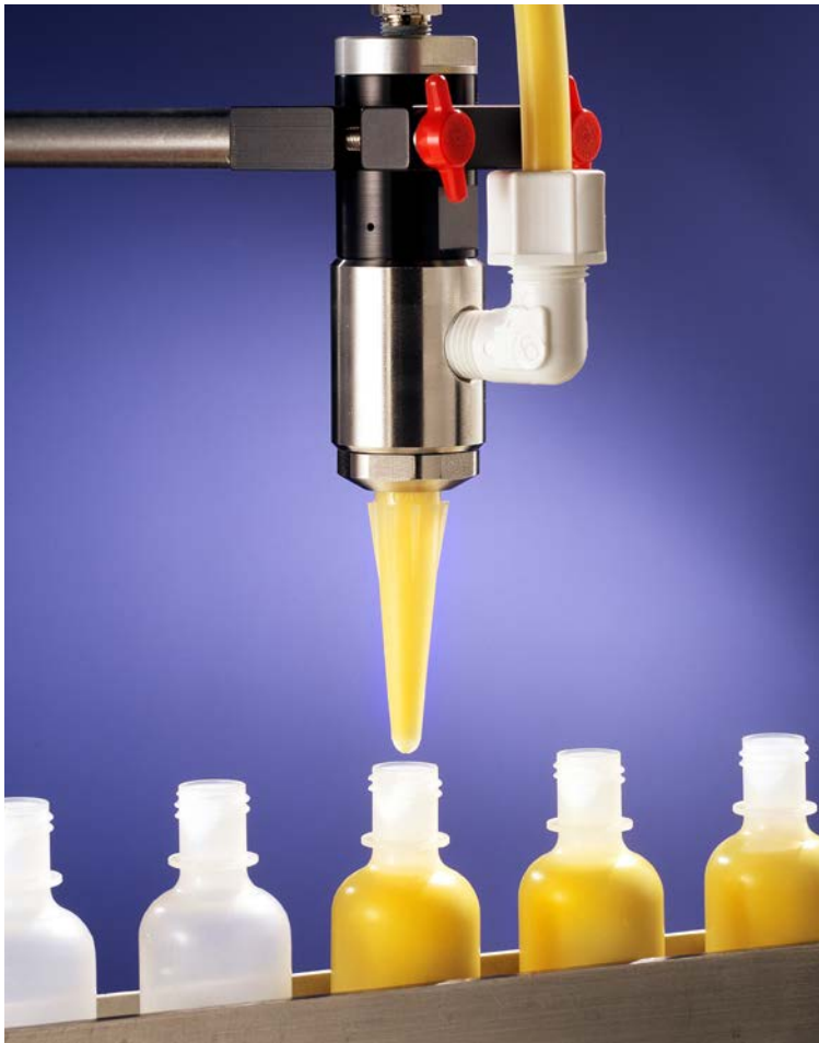
725HF-SS 大流量活塞阀将涂料灌装到瓶子中。