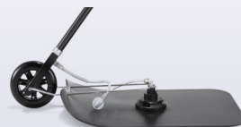
单轮毯式探头/单轮手推车探头