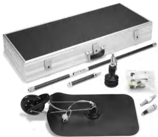
可快速更换的模块化探头系统