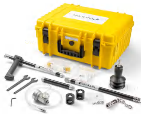
紧凑型设计更加灵活便利