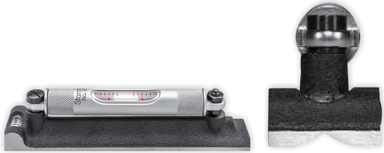
端部视图，显示渐开线槽

从6"到18"（150-450mm）型水平仪的主水准泡采用大约80-90秒或0.005英寸每英尺0.42毫米每米）的刻度。根据底板长度，气泡每侧有5、6或7条刻度线。