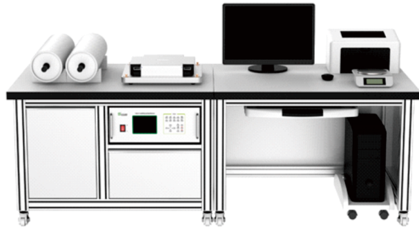
*上图为参考示意,实际交付可能会略有不同