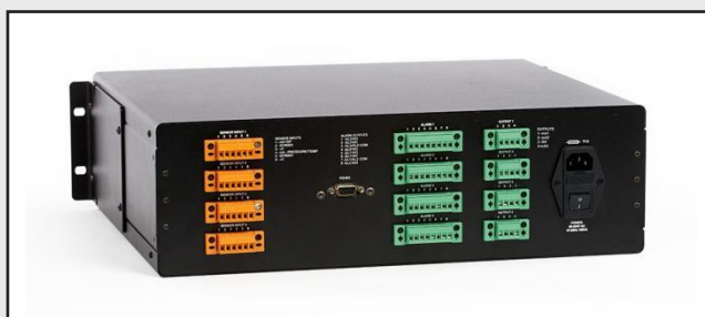
后面板输入/输出连接

MCU主机还可以通过与 Liquidew I.S. 液相微水分析仪或 Minox-i 氧变送器*相组合，提供液体中微水分析或氧测量功能。