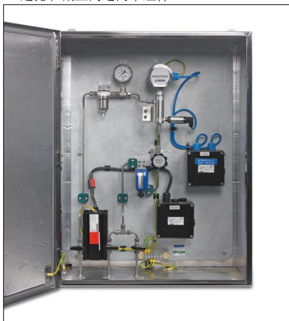
Promet I.S. 取样系统