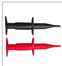
探头探钩 BP-368N (1000V/3A)