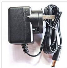
6V 适配器 W&T-AD1806A060030K (6V/0.3A)