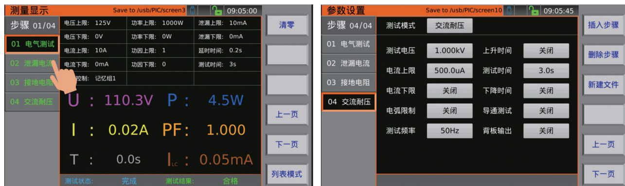
设置界面：同一页面设置所有参数

TH9130S/TH9131S系列多通道高功率耐压接地测试仪采用了7英寸800*480分辨率电容式触摸屏、Linux系统的安规测试仪器，其触摸式操作、交互式操作体验，大大缩短了仪器设置操作的时间，提高了效率。