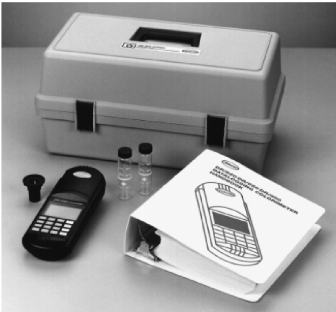
图1 DR/800系列色度仪标准包装*