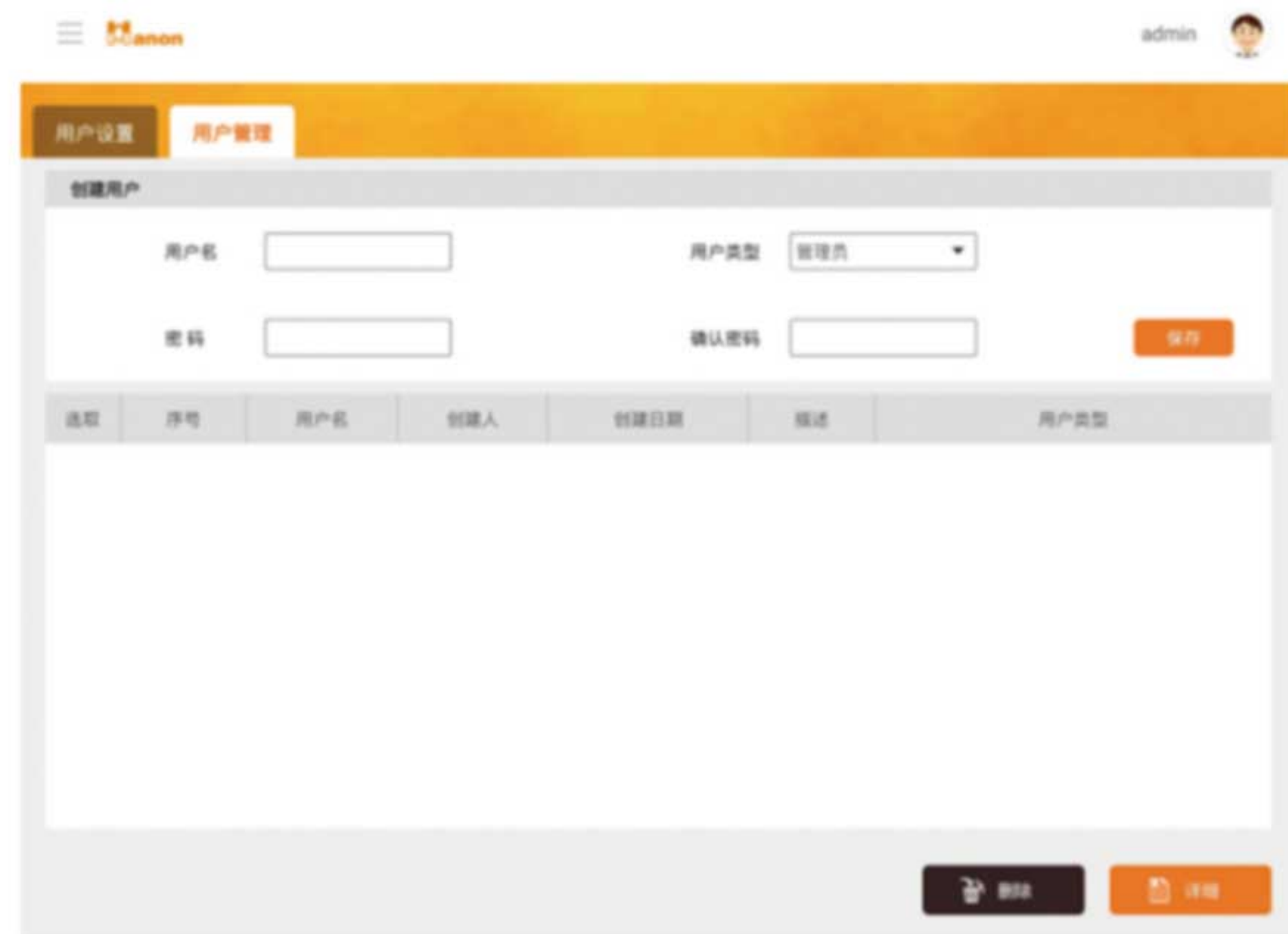
强大的用户分级管理界面

外壳采用 PEEK 材质，可耐受三氯甲烷、二氯甲烷、酸碱等溶液；接触液体部分采用强耐腐蚀不锈钢材质，对强酸强碱也有一定的耐腐蚀性能；可增配升级哈氏合金温控管，更强的耐腐蚀性能；针对装样控制，改进了液体流动路线，让装样的时候更少产生气泡。